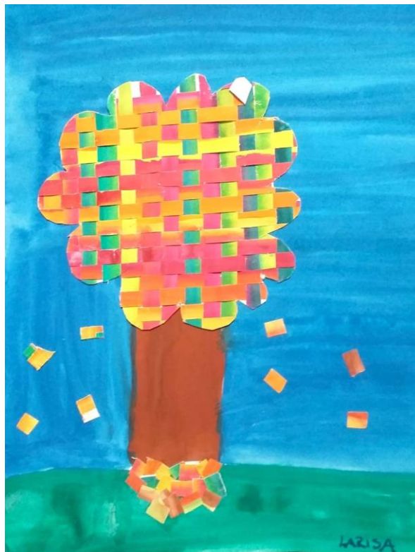
Larisa Pišljarič, 5. b