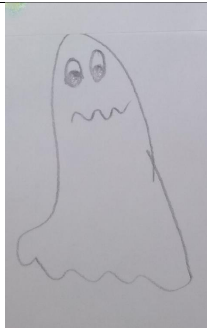
Kaja Kosmač, 3. b