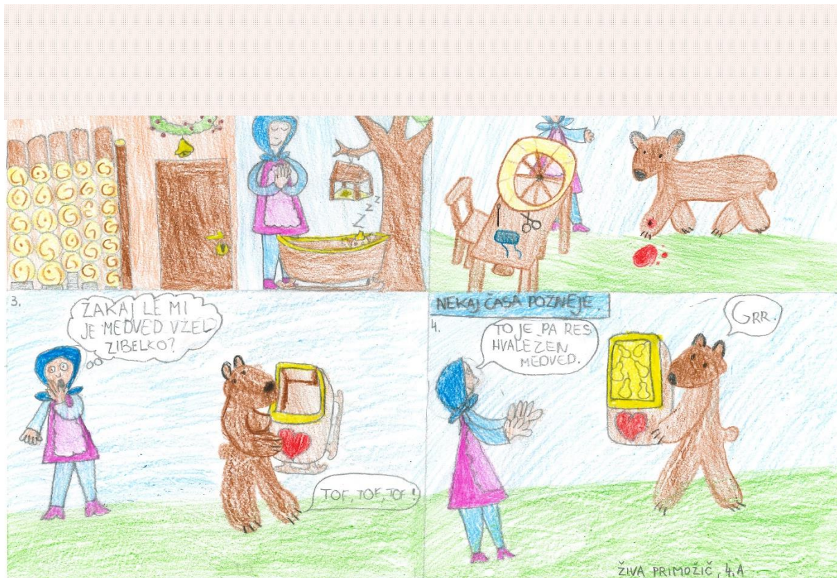
Živa Primožič, 4.a