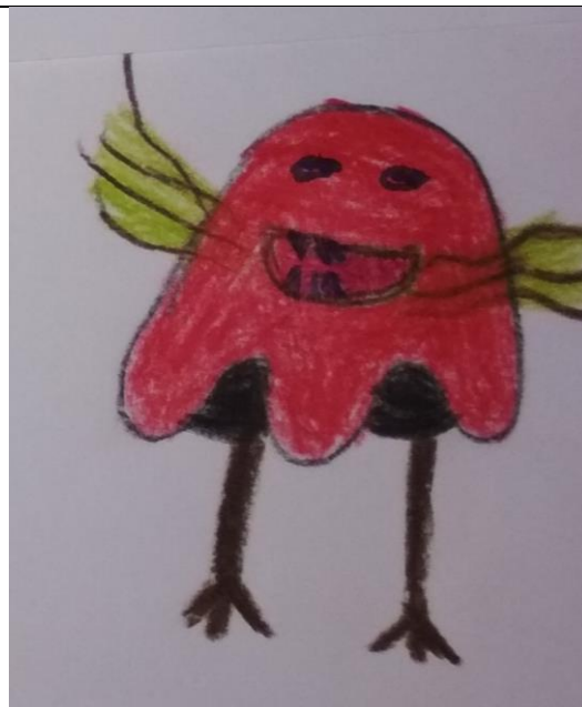
Terezija Praznik, 3. b