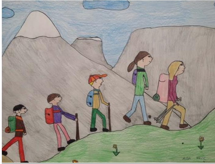
Ajda Frlic, 5. b