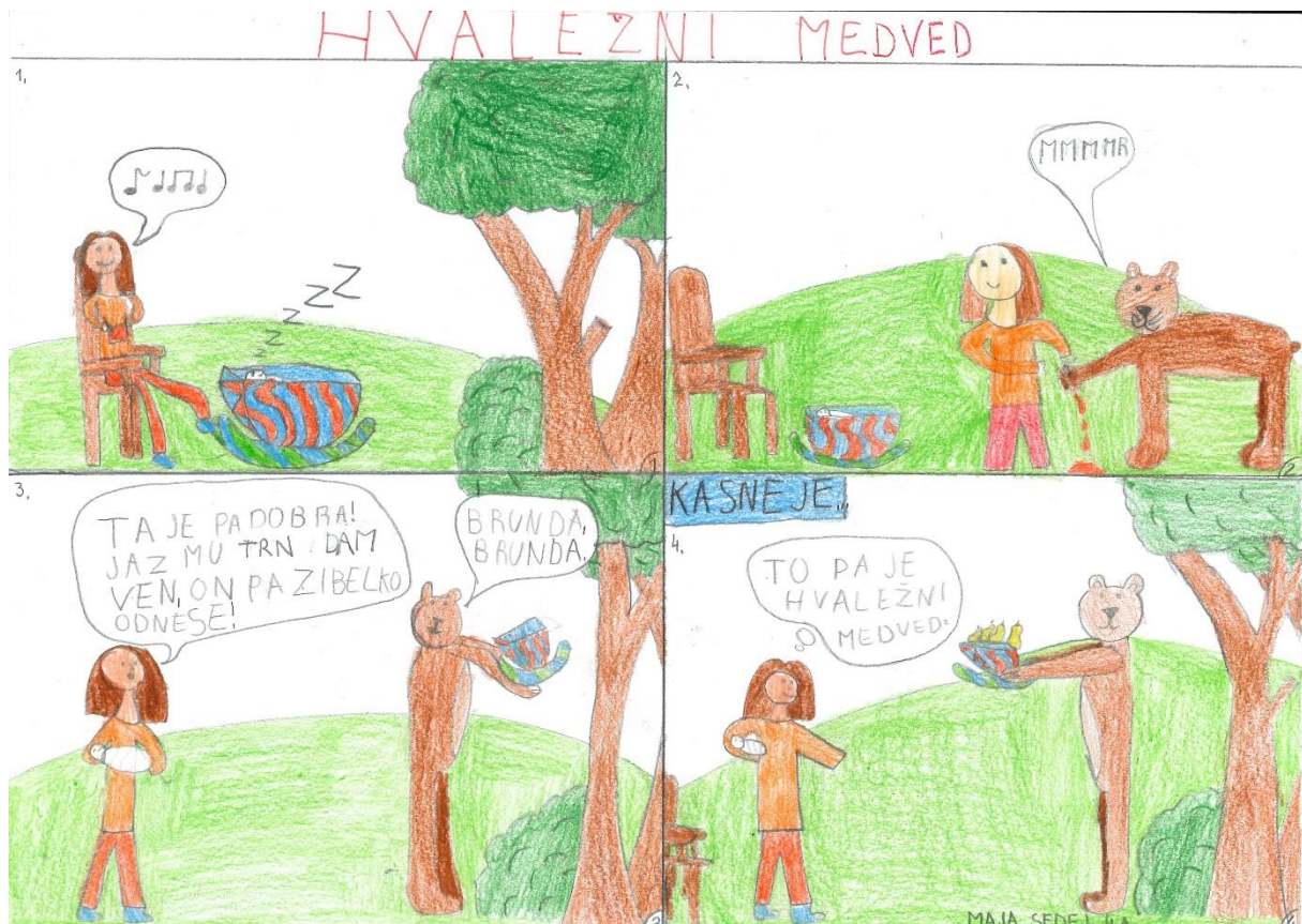
Maja Sedej, 4. a