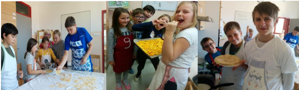
Fotografije iz srečanj Pestra kuhinja.

Ob četrtkih se srečujemo s skupino učencev od 3. do 9. razreda in kuhamo. Na voljo imamo 3 ure. V tem času se razdelimo v skupine, pregledamo recepte in si razdelimo naloge. V zastavljenem času moramo jedi pripraviti in servirati. Sledi skupno kosilo, komentiranje naše uspešnosti ter pospravljanje. Z učenci smo se prebili čez mesec testenin, juh in kruha. V oktobru smo se tako posvetili jušnim testenima, krpicam in idrijskim žlikrofum. V novembru smo pripravljali enostavne juhe in porabili naše »jušne priboljške« ter se lotili večjega podviga. Pripravili smo golaž in Chilli con carne. V decembru smo bili sprva malce manj uspešni pri pripravi kruha in krušnih izdelkov, zato smo zavihali rokave in se ponovno podali na delo. Preizkusili smo krog odličnosti »Napake vodijo k uspehu« in uspeli.