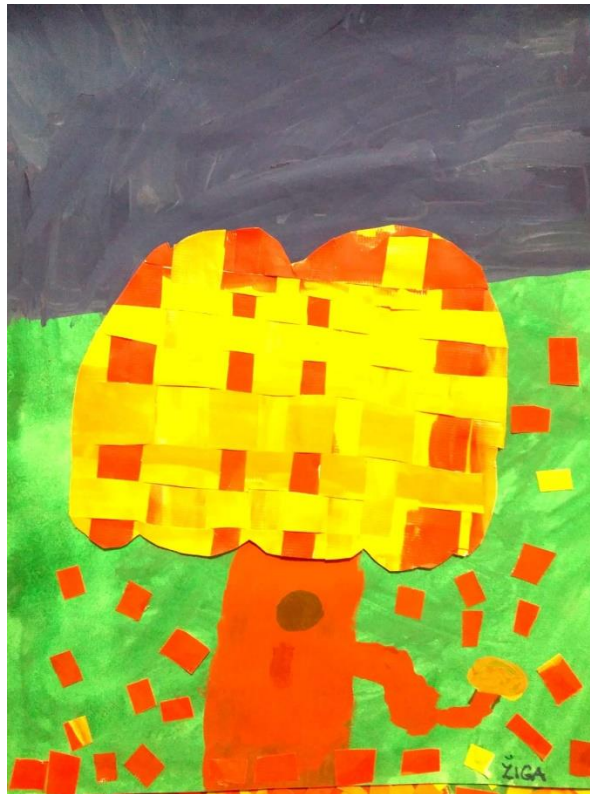
Žiga Brence, 5. b