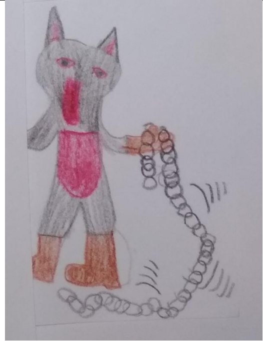
Manca Demšar, 3. b