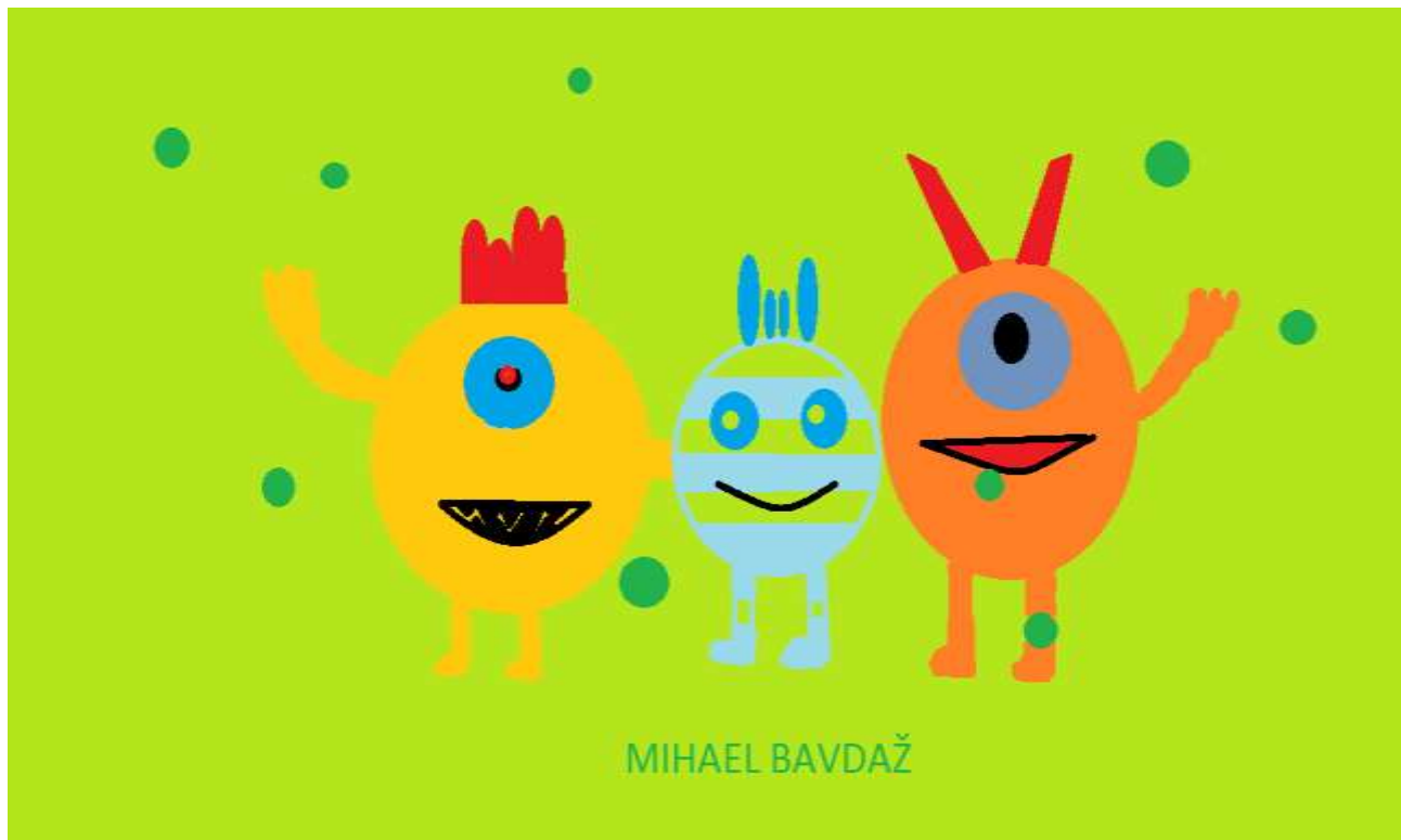
Mihael Bavdaž, 4. a

Nekoč je živela majhna Korona. Imela je tudi mlajšega brata, po imenu Omikron. A Omikron je bil nevoščljiv. Odločila sta se, da se odcepita. Korona je imela željo, da vse okuži. Tako je morala iz planeta Koronke odpotovati na Zemljo.