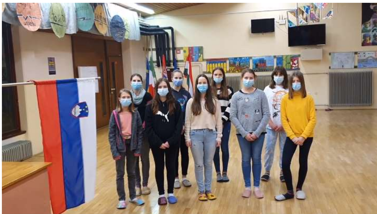
Mladinski pevski zbor ob kulturnem prazniku