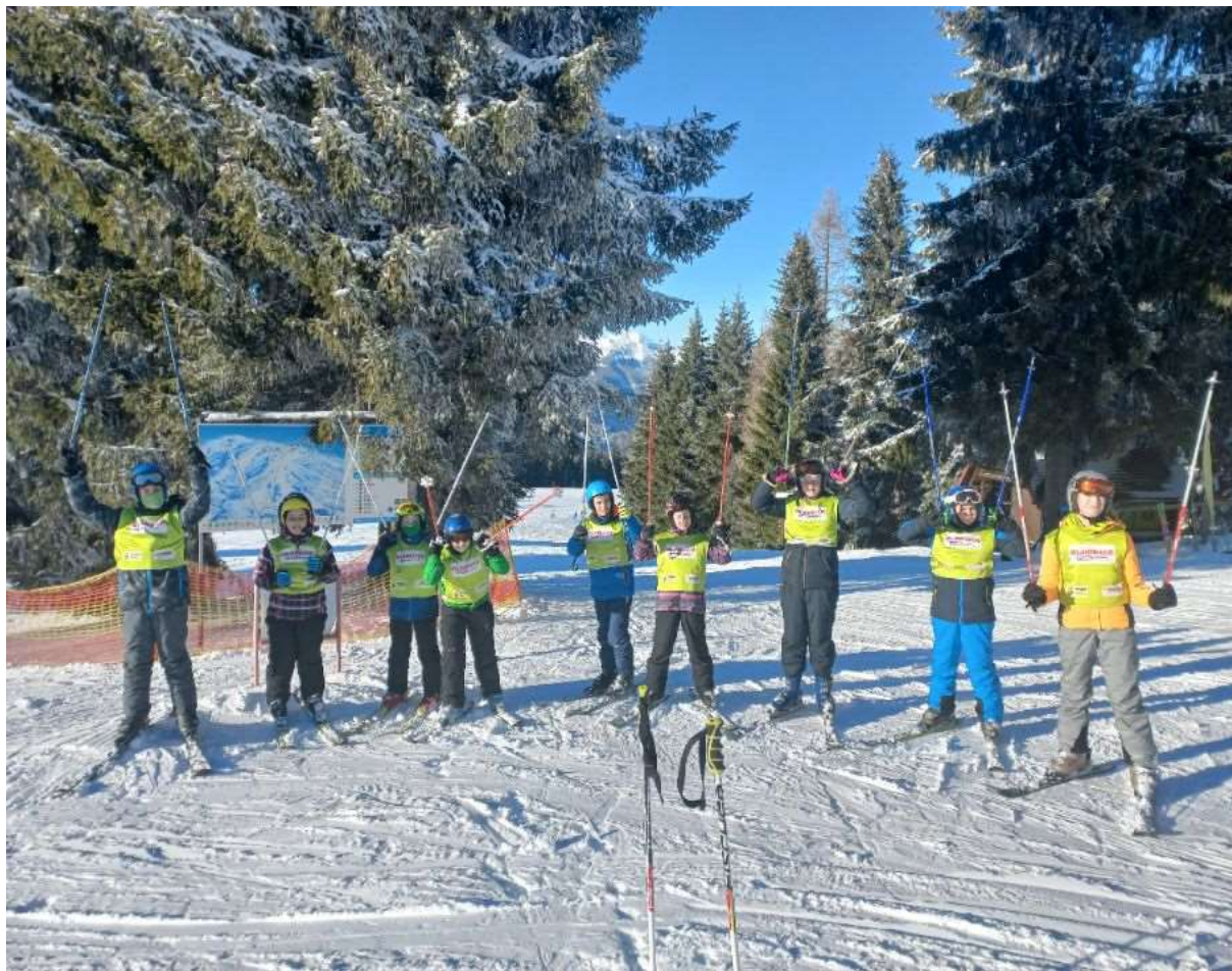
Veseli smučarji