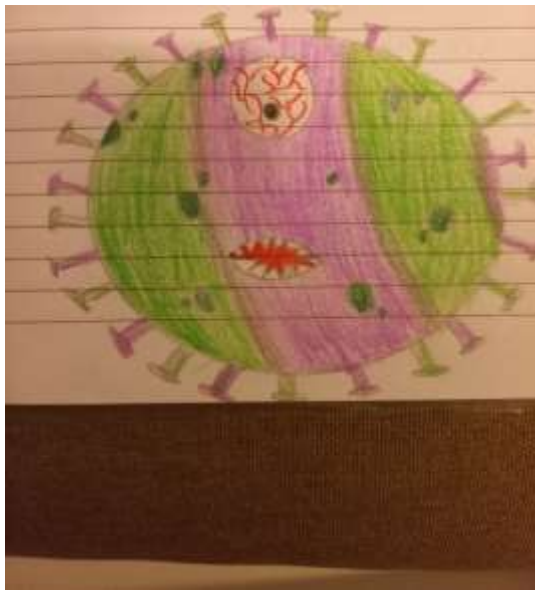
Tian Bizjak, 4. a