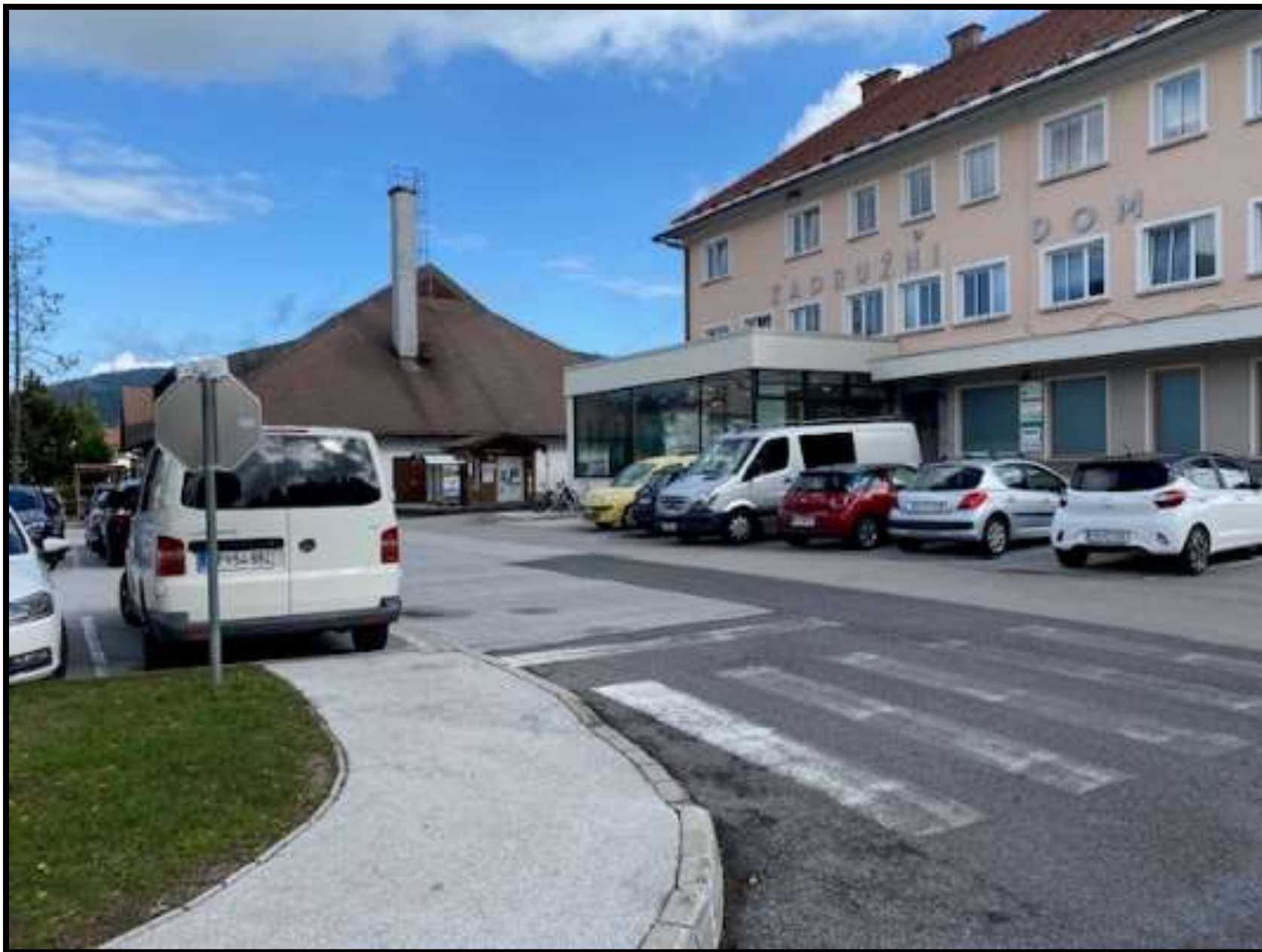
Slika 2: cesta mimo parkirišča Zadružni dom