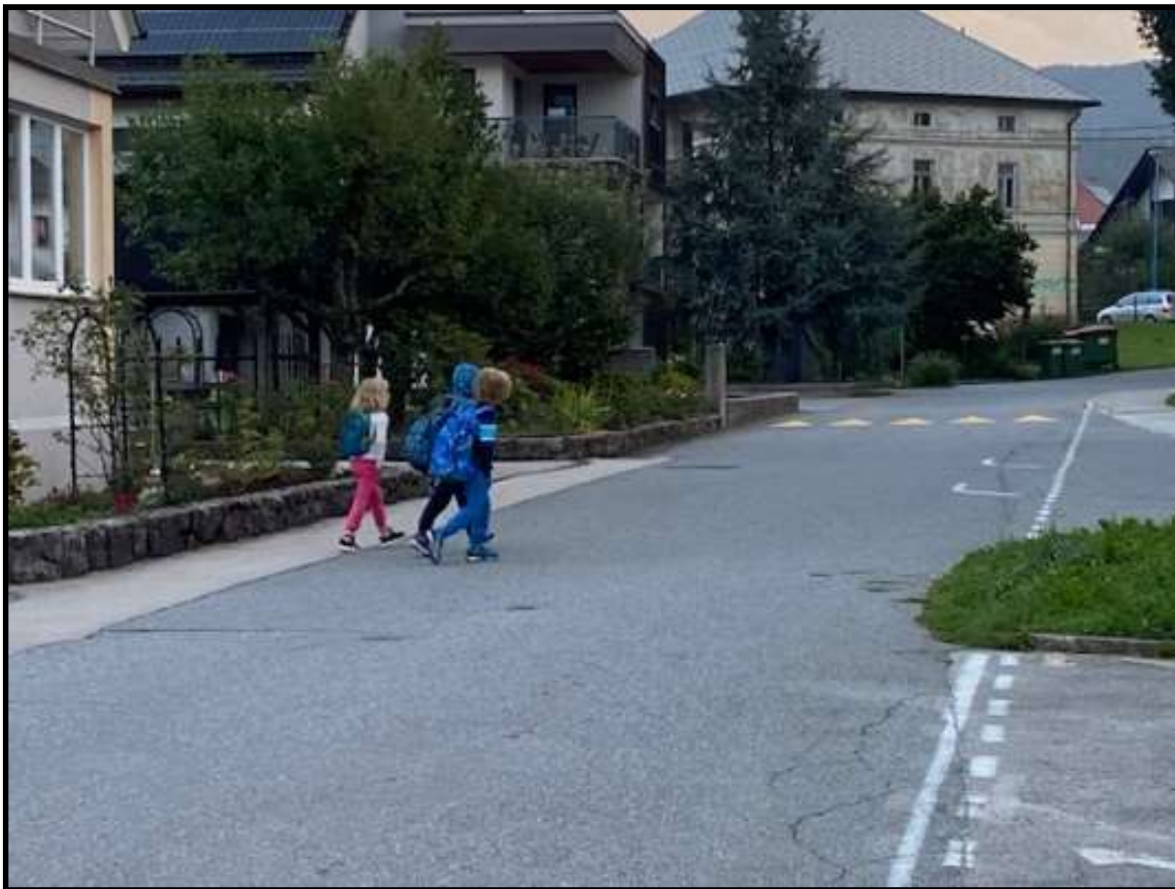
Slika 3: Prehod čez cesto Polje in Elektro - Šola