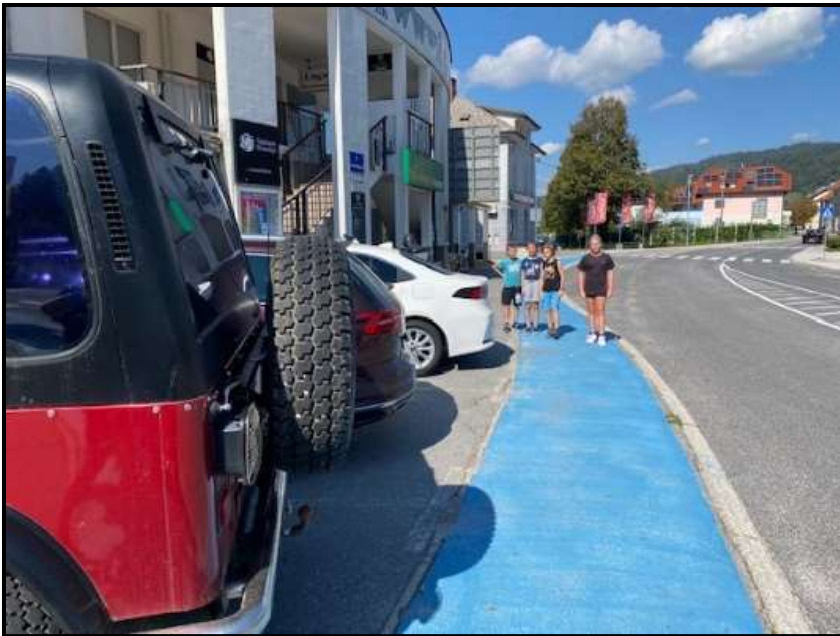
Slika 5: pločnik mimo Ambasade zaradi parkiranih vozil