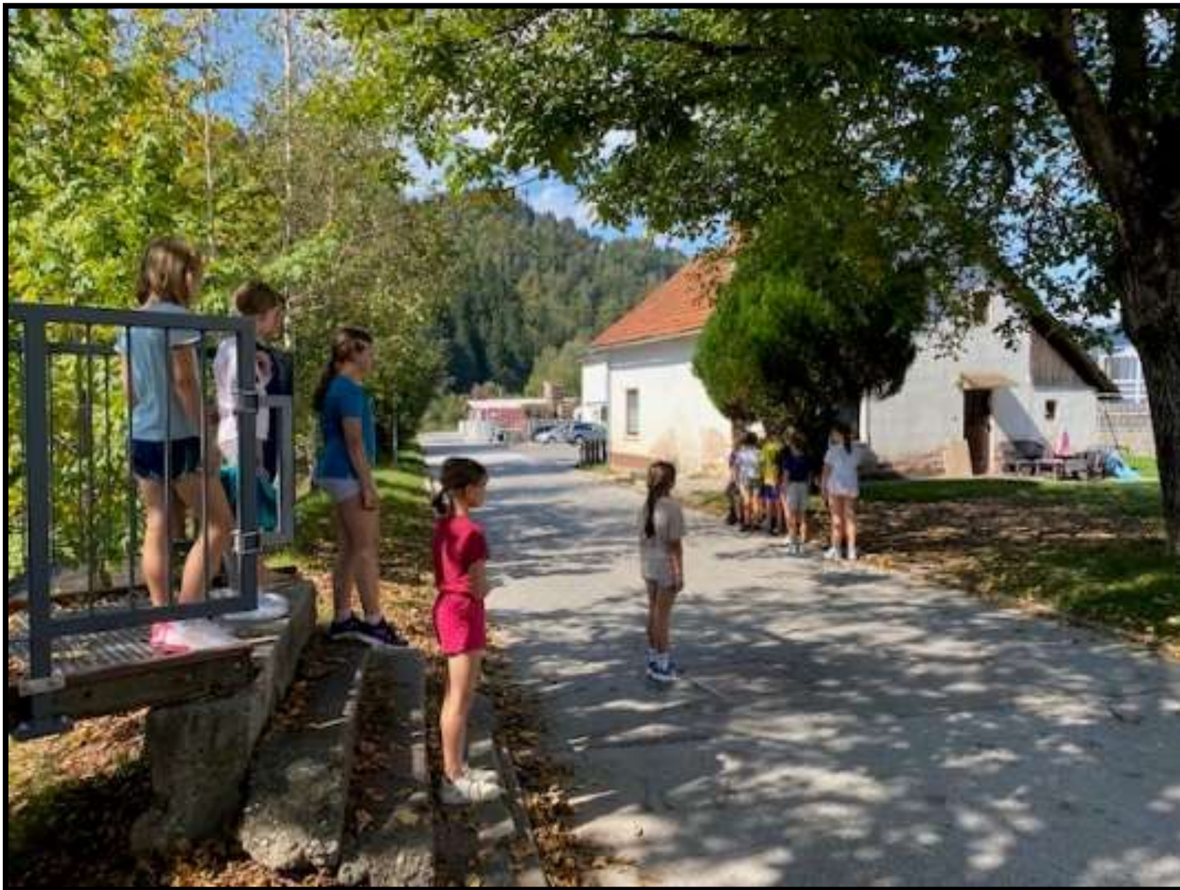
Slika 4: Prehod čez most Strojarska ulica - Polje