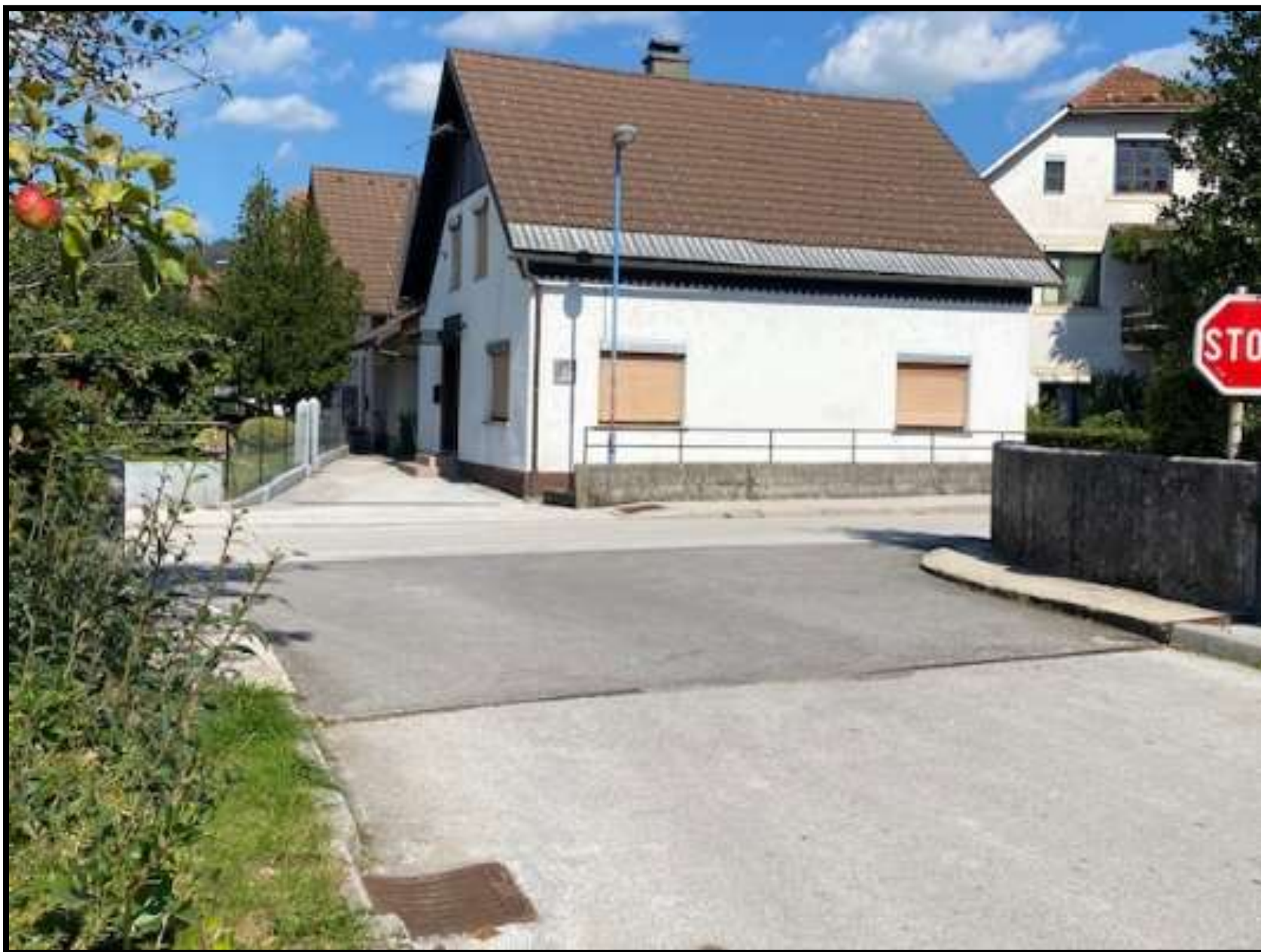
Slika 1: križišče Jezerska ulica in ceste za blagovnico